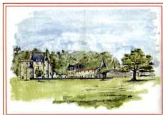
LE CHATEAU DE < BOUPAIRE PAR BAUD