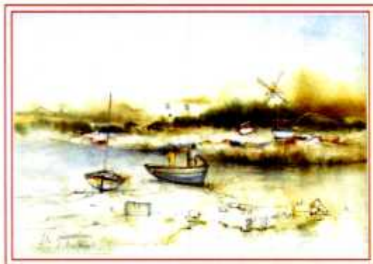
LE HAVRE DE LA < GACHERE PAR GUIGNARDEAU