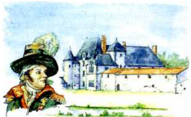
La Chabotterie Par A. Baud