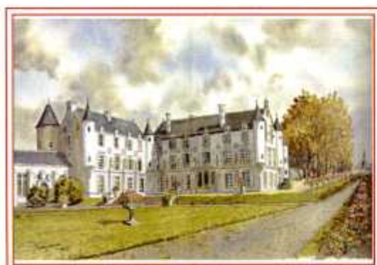
CHATEAU DE < FONTENAY LE-COMTE PAR PASQUEREAU