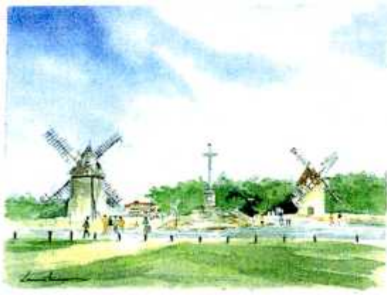
Le Mont des Alouettes Par A. Lamarti

La Vendée accueille, donne son soleil et ses plages, ses chemins secrets et ses pierres dorées, ses rivières et ses étangs, ses villages aux vacanciers de l'été. Voilà que ce pays qu'on disait fermé, amère et fanatique s'ouvre hardiment au monde, qu'il marche dans bien des domaines à l'avant-garde de la modernité, qu'il s'engage pour construire l'Europe, dans un idéal de paix et d'amitié entre les peuples.