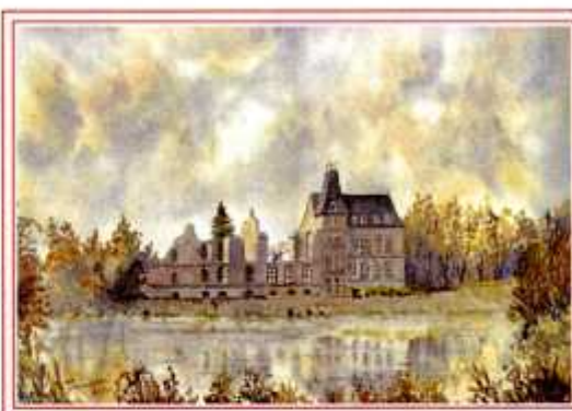
LE CHATEAU DU PUY DU FOU PAR > PASQUEREAU