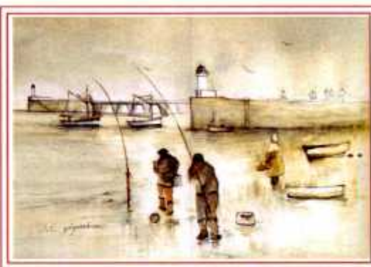
LES SABLES D'OLONNE PAR > GUIGNARDEAU