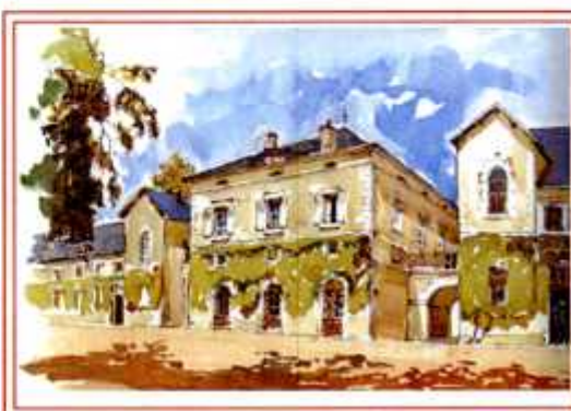
LE HARAS DE LA ROCHE-SUR-YON > PAR MAUDONNET