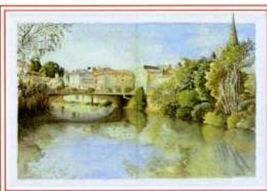
FONTENAY- LE-COMTE > PAR SARDINE