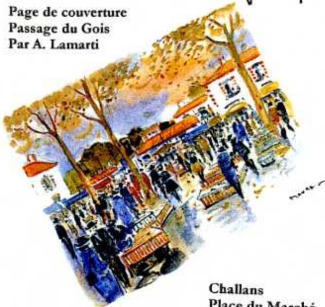
Challans Place du Marché R. Maura