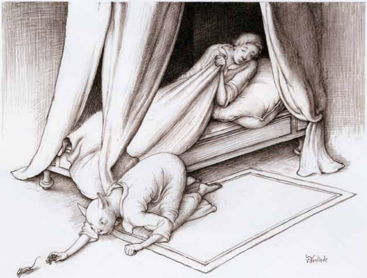
LA CHATTE MÉTAMORPHOSÉE EN FEMME