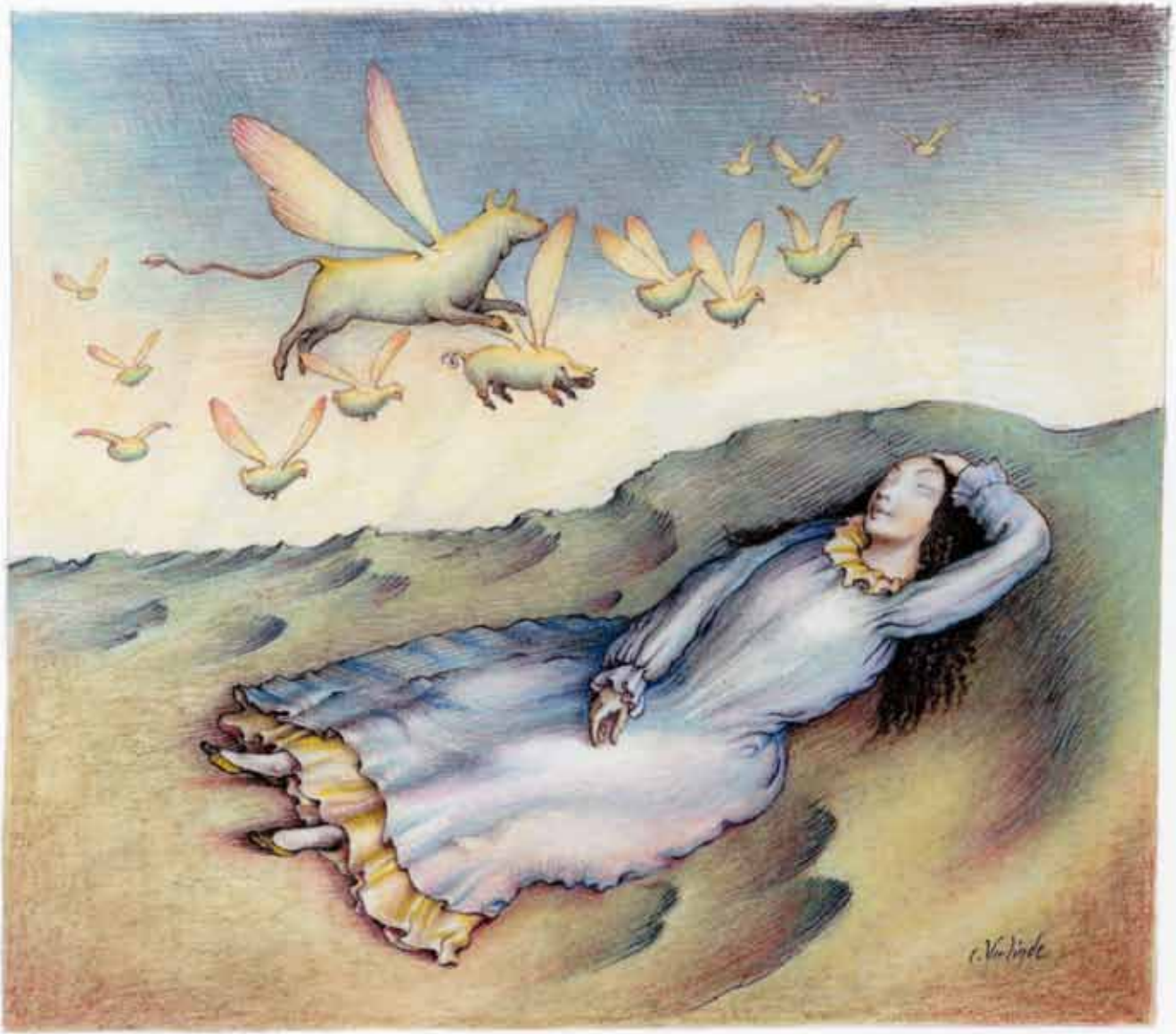
LA LAITIÈRE ET LE POT AU LAIT