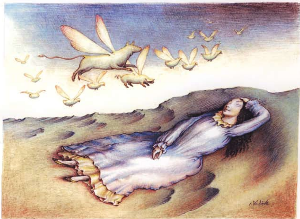
LA LAITIÈRE ET LE POT AU LAIT